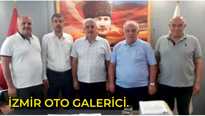
İZMİR OTO GALERİCİ.